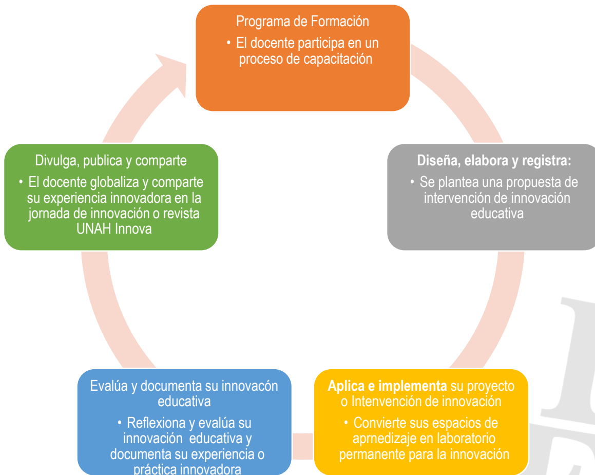
Ilustración 1 Ciclo de Innovación Educativa UNAH