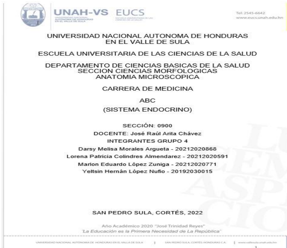
Imagen No. 8: Informe Final