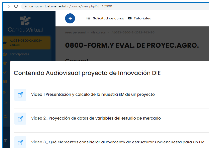
Figura 2: Vídeos creados disponibles en campus virtual de la UNAH a los cuales accedieron los estudiantes de la asignatura.

En la figura 3 se observa el total de visualización y los comentarios en cada uno de los vídeos. El total de estudiantes que formaron parte del estudio fueron 31 donde cada uno de ellos solo podían acceder al contenido práctico solo si ingresaban al enlace desde el espacio virtual de la UNAH, esto con el objetivo de controlar las vistas, los comentarios generados y así verificar si el estudiante estaba accediendo al conocimiento de manera correcta. El 100% de los estudiantes accedieron a los vídeos, donde los visualizaron y más del 50% procedieron a comentar sobre el contenido explicado.